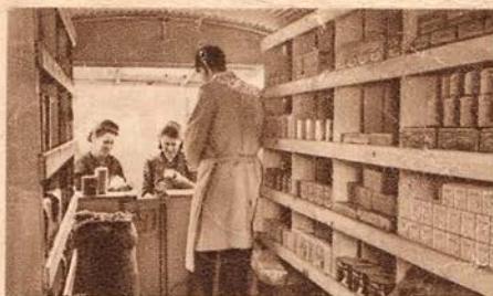
1 m 85 de hauteur intérieure