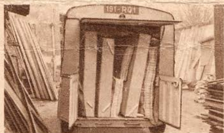
Un plancher plat