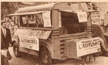
Un étalage sur les côtés