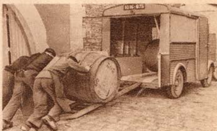
Un plancher bas (0 m 35 en charge)